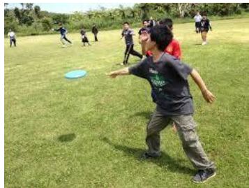
フライングゴルフ