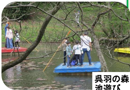
呉羽の森で 池遊び

呉羽丘陵（里山）の自然の中で遊ぶ体験と 富山県の名山「立山」のよさに触れる「いいとこどり」の企画！ 呉羽青少年自然の家の活動プログラムで思い切り遊ぼう！芦峯周辺施設を 見学して立山開山の歴史を学ぼう！登山研究所の壁登り体験で鍛えよう！ス ペシャルガイドの講演や室堂散策など、日頃味わえない貴重で魅力あるプロ グラムが盛りだくさん！今夏の思い出づくりにぜひご参加ください！