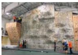
国立登山研究所で クライミングに チャレンジ